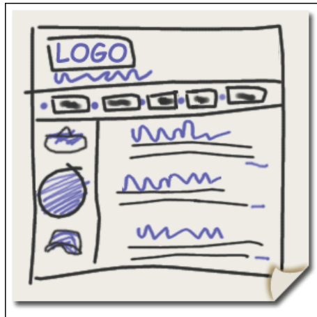
Het voorontwerp van een pagina

Nier alle beeldschermen zijn hetzelfde. Het meest gebruikte scherm op dit moment is 1024x768. Maar nog ruim 15% gebruikt een scherm van