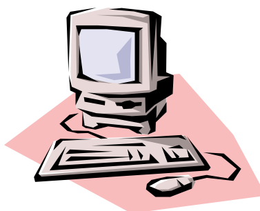
Caption describing picture or graphic.

Het maken van een eigenwebsite was vroeger iets waarvoor je door geleerd moest hebben. Maar dankzij de moderne software is het hebben van een eigen website voor mensen weggelegd. Kennis van Hyper Tekst Markup Language (HTML) of Java is niet langer nodig om snel een fraai ogend product te maken. Ook het vinden van een bedrijf dat er voor zorgt dat de eigen website op het internet geplaatst wordt is met het toenemend aantal ADSL verbindingen al evenmin noodzakelijk. Immers, de meeste internet providers bieden naast het ADSL